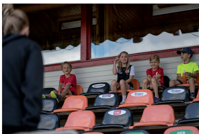
Ovan: Förutom friidrott är det även teori om kost på programmet. "Vad är er favoritmat? – varmkorv!"