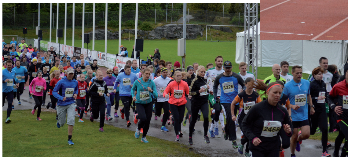
Full rusning i 5-kilometersloppet.